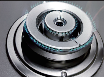
三环火焰炉头（右侧）